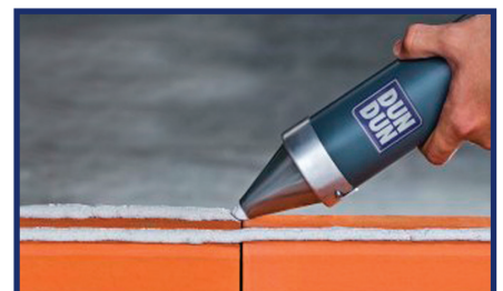
Dosificación con aplicador