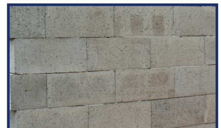
Distancia entre bloques