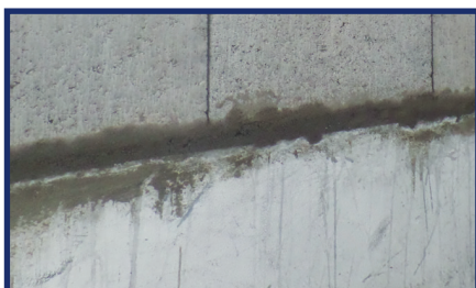
Nivelamiento primera hilada

- En caso de existir problema de nivelación y plomo del tabique durante la elevación del tabique se indica la utilización de cuñas de soporte para ajustes menores, iguales a 3mm. - Para correcciones excepcionales mayores a 4mm en la nivelación del tabique se recomienda la aplicación de una hilada con mortero convencional antes de proceder con la aplicación de Massa DunDun. - Se sugiere la utilización del detalle particular de nivelación con mezcla tradicional en caso de muro doble interior-exterior