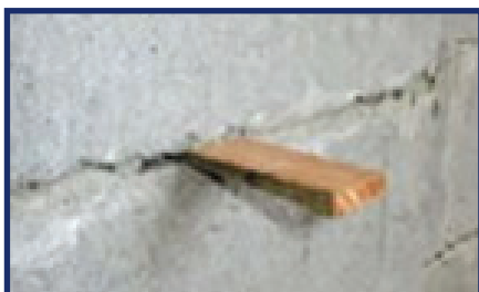
Nivel y plomo